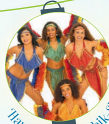
Hawaii- und Karibik-Show