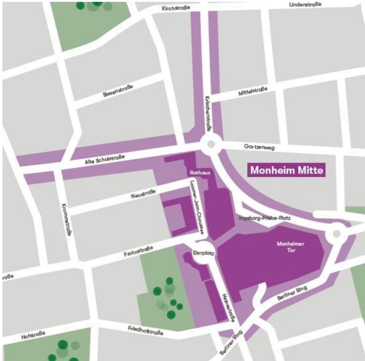
Abgrenzung Gebiet Monheim-Mitte

Im Bereich der Innenstadt (Monheim Mitte) sind über die oben angegebenen Farben hinaus Zusatzfarben in Anlehnung an die im Folgenden aufgeführten Farbtöne für Bestuhlung sowie für den Wetter- und Sonnenschutz zulässig: