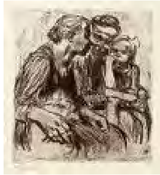
(Käthe Kollwitz: Drei Frauen im Gespräch)