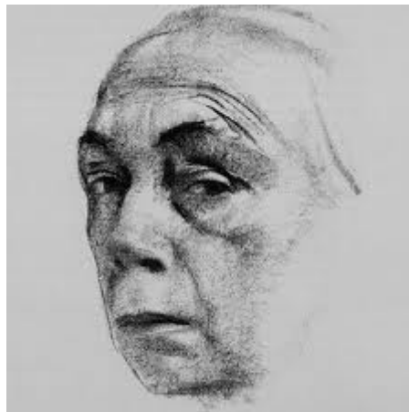
(Selbstbildnis K. Kollwitz)